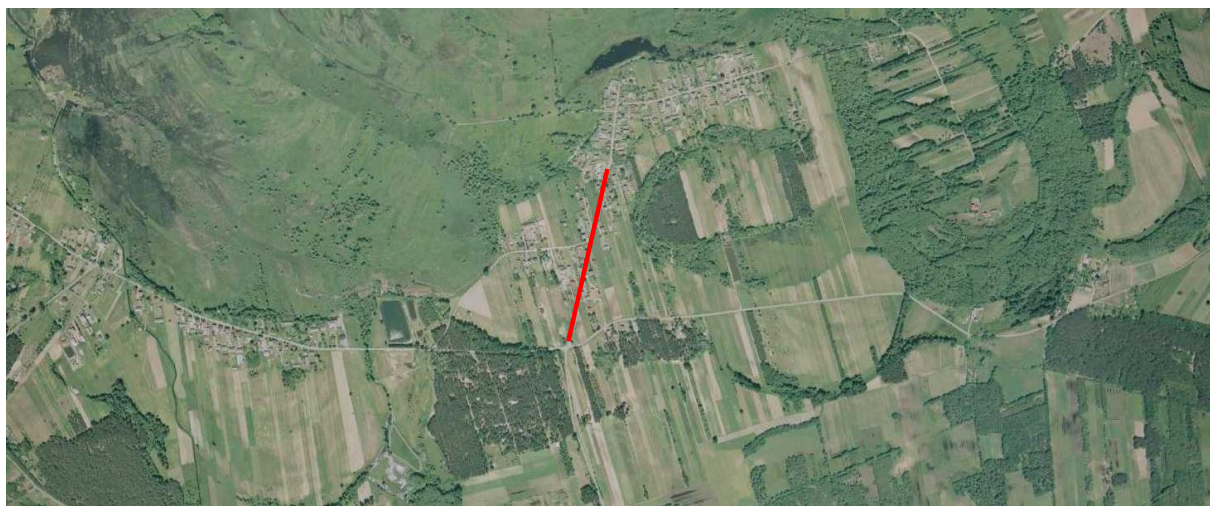
Rys. 1 Lokalizacja inwestycji