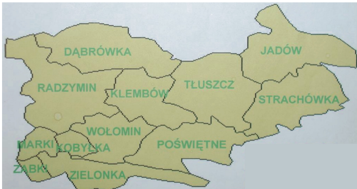
Rysunek 1: Mapa powiatu wołomińskiego

stanowią uprawy rolne, 20% lasy i ok. 10% tereny zurbanizowane. Pas lasów ciągnie się równoleżnikowo środkiem gminy i łączy się z leśnym korytarzem ekologicznym gmin sąsiednich.