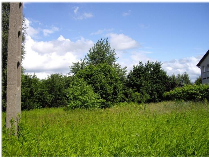
Zdjęcie 3 Zielenie nieurzędzona na obszarze opracowania