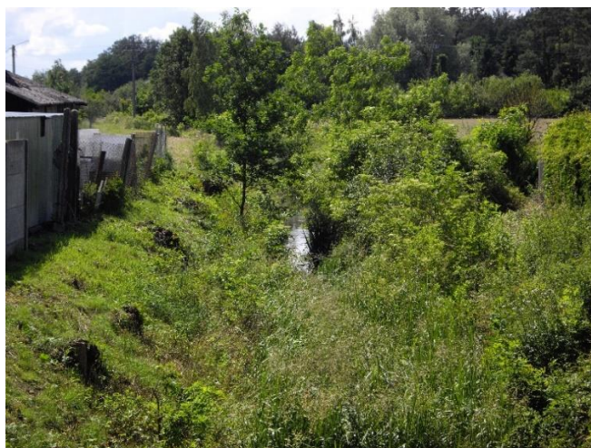
Zdjęcie 4 i 5 Rów odwadniający na obszarze opracowania (źródło: własne)

Na obszarze gminy poza doliną Bugu najwięcej gatunków zwierząt występuje w zbiorowiskach leśnych, będących najbogatszymi biotopami. Wśród ssaków wyróżnić możemy liczne gryzonie, takie jak: smużka leśna, mysz leśna, nornica ruda, a także nietoperze (np. mroczek późny) oraz niewielkie drapieżniki (np. kuna leśna). Przedstawicielami gatunków większych ssaków na terenie gminy są sarna europejska i wilk szary. Dodatkowo w lasach napotkać można zięby, rudziki i świergotki drzewne, a także dzięcioły, sikory i muchołówki. Natomiast otwarte przestrzenie uprawno-łąkowe, sprzyjają występowaniu ptaków drapieżnych, głównie myszołowów. Środowiska te sprzyjają również występowaniu gadów, takich jak padalec zwyczajny, jaszczurka zwinka czy żmija zygzakowata oraz gryzoni (np. mysz polna). Ponadto obszar gminy Dąbrówka charakteryzuje się bogatą fauną bezkręgowców, w szczególności pająków, a także motyli (np. czerwończyk nieparek, szlaczkoń szafraniec). Bardzo ważnym elementem świata żywego występującego na terenie gminy jest jedyne znane stanowisko