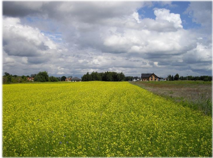
Zdjęcie 4 Grunty orne na obszarze opracowania