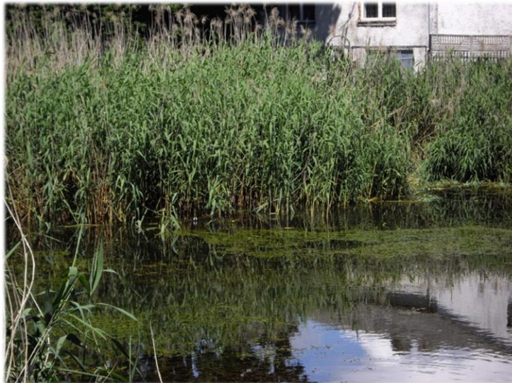
Zdjęcie 1 Roślinność szuwarowa przy oczku wodnym