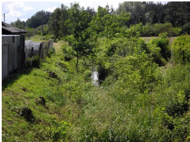
Zdjęcie 5 i 6 Rów odwadniający na obszarze opracowania

Na obszarze gminy poza doliną Bugu najczęściej gatunków zwierząt występuje w zbiorowiskach leśnych, będących najbogatszymi biotopami. Wśród ssaków wyróżnić możemy liczne gryzonie, takie jak: smużka leśna, mysz leśna, nornica ruda, a także nietoperze (np. mroczek późny) oraz niewielkie drapieżniki (np. kuna leśna). Przedstawicielami gatunków większych ssaków na terenie gminy są sarna europejska i wilk szary. Dodatkowo w lasach napotkać można zięby, rudziki i świergotki drzewne, a także dzięcioły, sikory i muchołówki. Natomiast otwarte przestrzenie uprawno-łąkowe, sprzyjają występowaniu ptaków drapieżnych, głównie myszołowów. Środowiska te sprzyjają również występowaniu gadów, takich jak padalec zwyczajny, jaszczurka zwinka czy żmija zygzakowata oraz gryzoni (np. mysz polna). Ponadto obszar gminy Dąbrówka charakteryzuje się bogatą fauną bezkręgowców, w szczególności pająków, a także motyli (np. czerwończyk nieparek, szlaczkoń szafraniec). Bardzo ważnym elementem świata żywego występującego na terenie gminy jest jedyne znane stanowisko