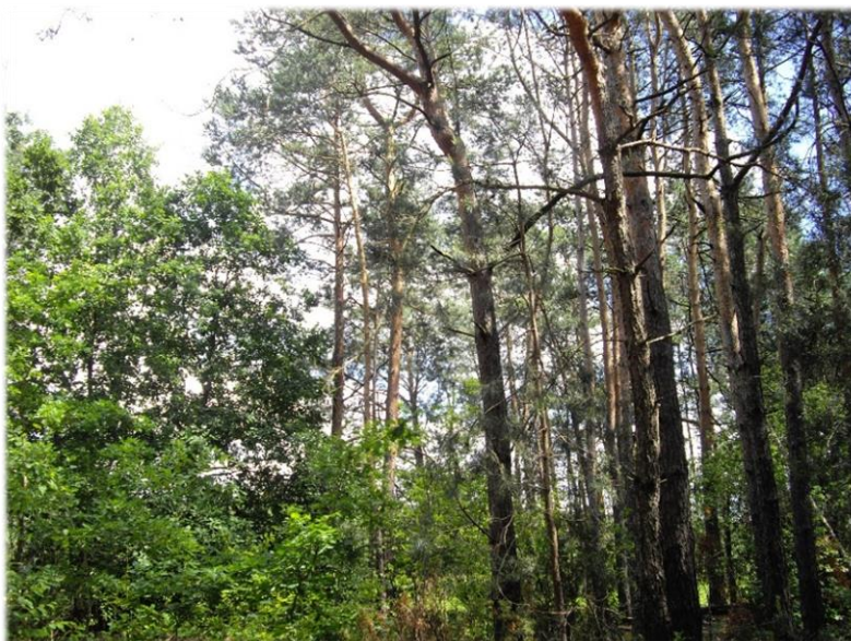
Zdjęcie 2 Las na obszarze opracowania