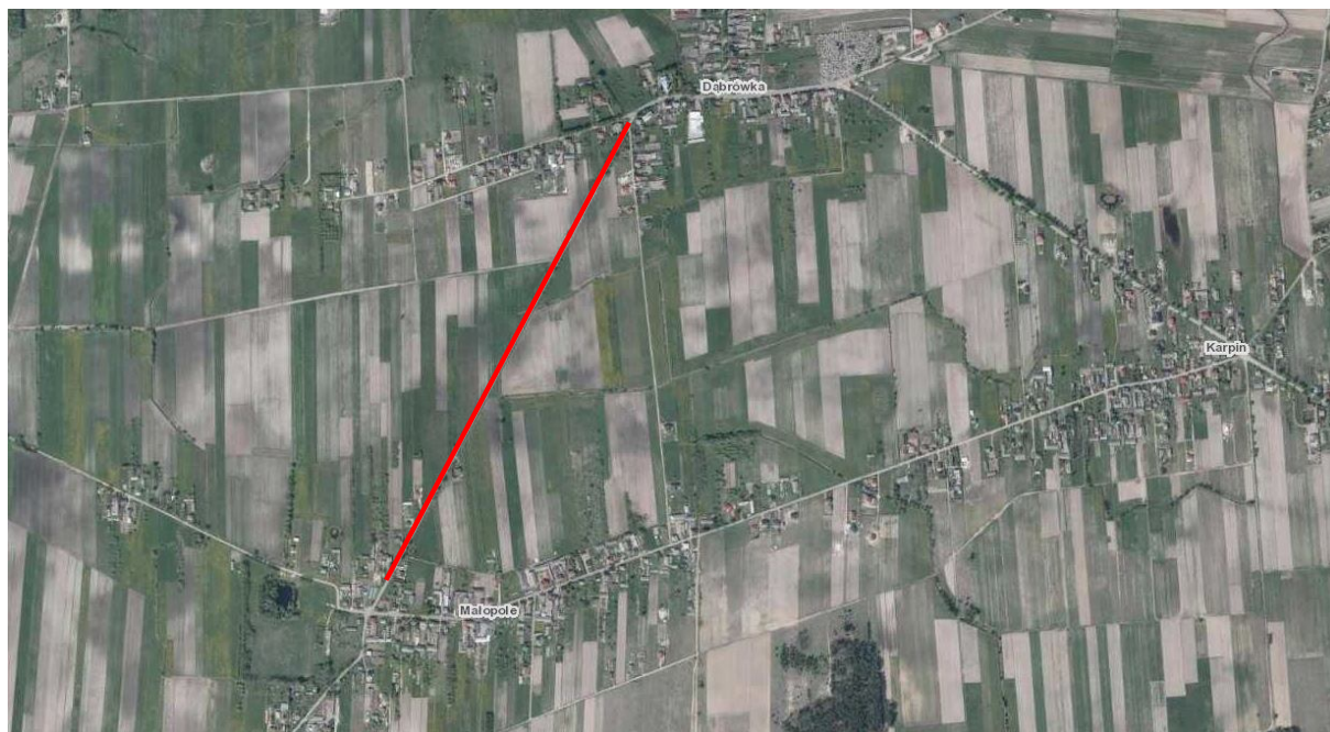
Rys. 1 Lokalizacja inwestycji

technicznych (Rys. 1). Na przedmiotowym odcinku istniejąca droga posiada nawierzchnię asfaltową o szerokości od 5,0 do 5,75 m wraz z obustronnymi poboczami gruntowymi.