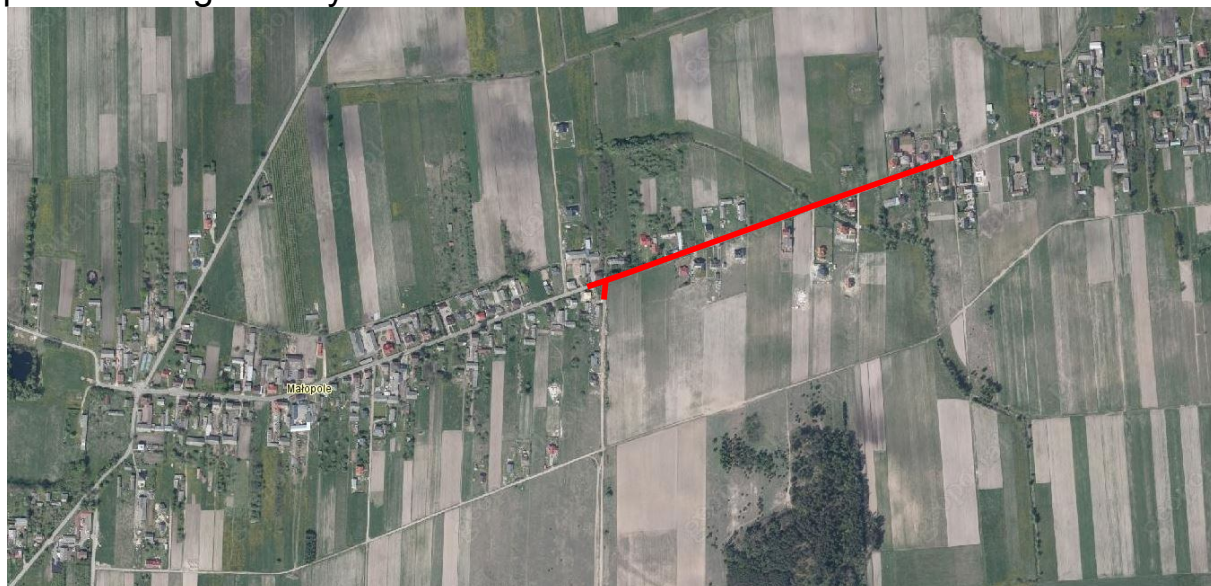
Rys. 1 Lokalizacja inwestycji

Przebudowywana droga przebiega przez tereny zabudowy mieszkaniowej, mieszkaniowo - usługowej, produkcji i usług technicznych (Rys. 1). Na przedmiotowym odcinku istniejąca droga posiada nawierzchnię asfaltową o szerokości 5,0 wraz z obustronnymi poboczami gruntowymi.