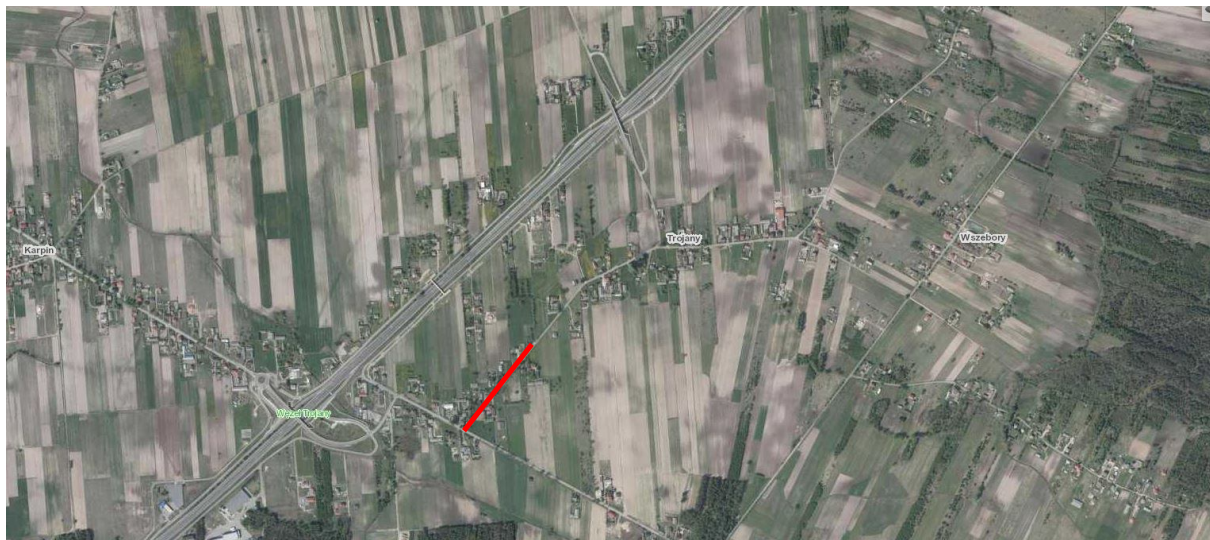
Rys. 1 Lokalizacja inwestycji