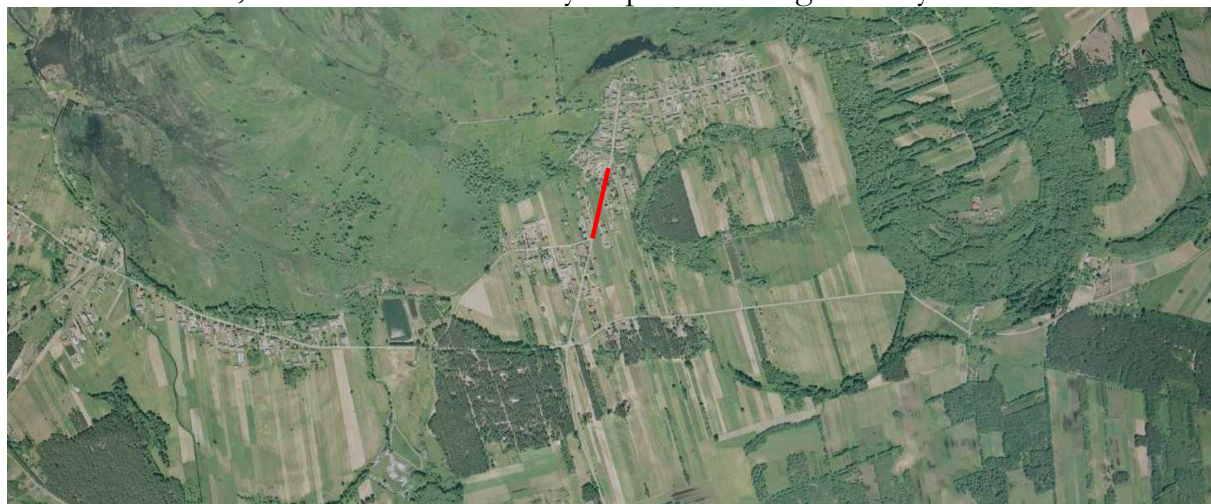
Rys. 1 Lokalizacja inwestycji

Przebudowywana droga przy, której zlokalizowano chodnik przebiega przez tereny zabudowy mieszkaniowej, mieszkaniowo - usługowej i zagrodowej (Rys. 1). Na przedmiotowym odcinku istniejąca droga posiada nawierzchnię asfaltową o szerokości od 5,0 m wraz z obustronnymi poboczami gruntowymi.