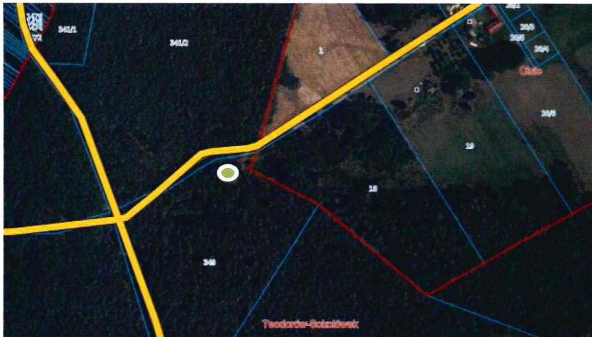
Zdjęcie satelitarne lokalizujące przyszły pomnik przyrody.